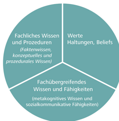
Abbildung 1: Kompetenzbereiche, die während des Studiums entwickelt werden sollten

Diese Bereiche können in verschiedenen Anforderungsstufen vermittelt bzw. erlernt und geprüft werden. Je nach Anforderungsstufe geht es darum, Inhalte erinnern, verstehen, anwenden, analysieren, bewerten, erweitern oder erschaffen zu können. Bei Prüfungen sind entsprechend Aufgabenstellungen zu finden, mit denen die jeweilige Anforderungsstufe überprüft werden kann. Die Aufgabenstellungen können meist durch verschiedene Prüfungsformate realisiert werden.