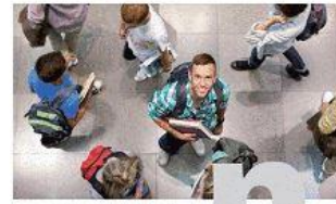
Ein Leitfaden für Hochschulen (Kurzfassung)

Anerkennung von im Ausland erworbenen Studien- und Prüfungsleistungen