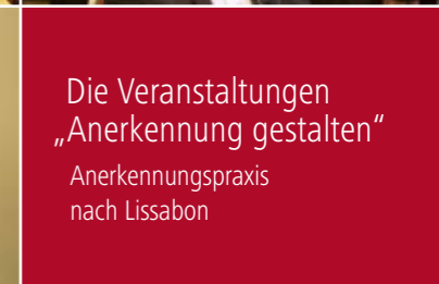
Die Veranstaltungen „Anerkennung gestalten“ Anerkennungspraxis nach Lissabon